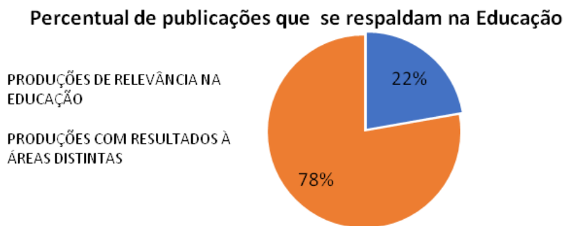
Gráfico 02: Número percentual de publicações que são direcionadas à Educação.

tendo como filtro uma perspectiva de perceber se os 45 trabalhos encontrados contribuem para o campo da educação, visto que a prioridade aqui demonstrada é compreender como as jovens mulheres grávidas estão inseridas no contexto escolar, tivemos o seguinte percentual de relevância nas publicações: