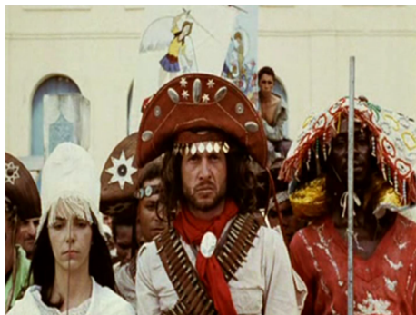
Figura 2 - Coirana fala de sua missão ao público