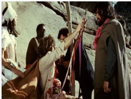
Figura 4 – Coirana revela que Antônio das Mortes é o Dragão da Maldade

Fonte: O Dragão da Maldade Contra o Santo Guerreiro (1969).