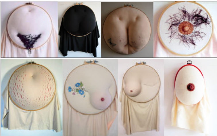
Figura 1 – Imagens do acervo Arquivos de Bordados e Costura

A seguir, é possível conferir, em algumas imagens, a investigação dos corpos de Hewett – que expõem imperfeições da pele, singularidades da cor, sinuosidades e irregularidades das formas, dos pelos, das deformidades e das mutilações... em contraponto estético a todas as exigências de perfeição objetual do feminino: