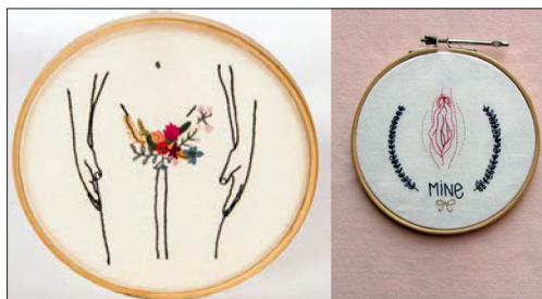
Figura 6 – Imagens de divulgação