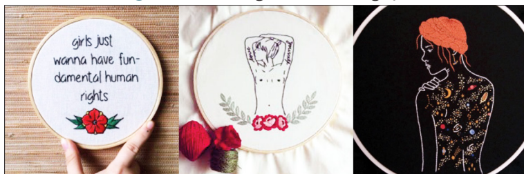
Figura 5 – Imagens de divulgação