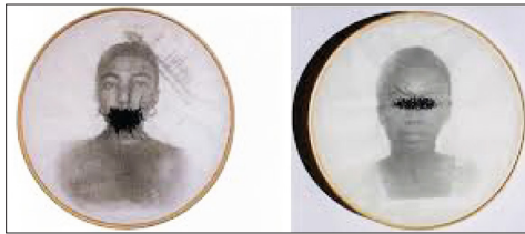
Figura 2 – Imagens da coleção Bastidores (1997)

à vida do(a)s escravizado(a)s trazido(a)s ao Brasil. Recompõe as suas imagens em emendas desencontradas, retratando nas aplicações mal costuradas os reflexos de um deslocamento imposto pela captura e pelo tráfico dessas pessoas – as quais, no desafio de refazerem-se, encontram em tal tarefa a impossibilidade da completude no presente, porque lhes grava, em nível pessoal e em nível social, uma sutura perversamente malfeita e inacabada sobre os seus corpos, precisamente no que recende à democracia e à sua hipocrisia. Seguem-se algumas imagens exemplares das duas exposições, respectivamente: