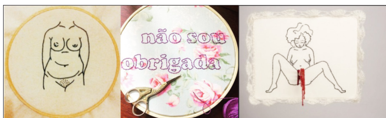
Figura 7 – Imagens de divulgação