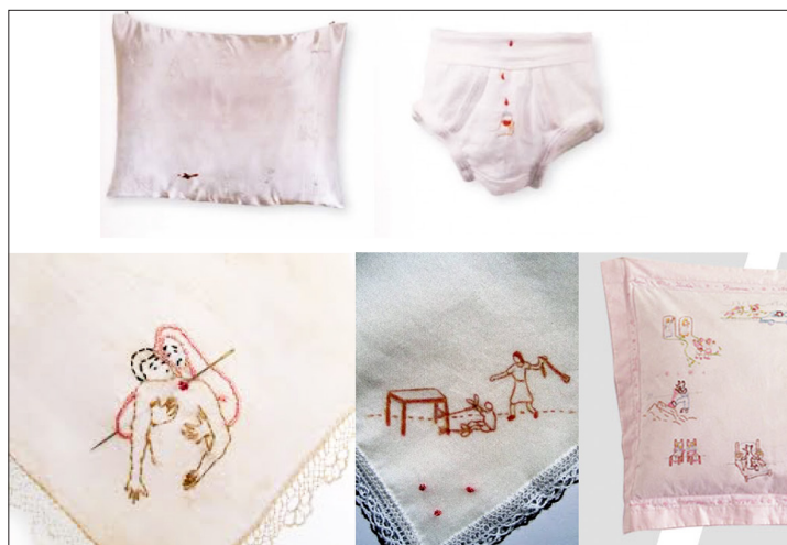
Figura 4 – Imagens de acervo

A segunda artista brasileira que promove uma crítica às situações relacionadas a gênero é a carioca, tal como Rosana Palazyan. Ela representa, em seu bordado, cenas que reportam à violência sexual e infantil. Nessa obra, o olhar do espectador é provocado a interpretar o que está além do delicado fio, das cores alegres, daquilo que com sutileza é cosido à tela. É pela retratação de objetos cotidianos, como, por exemplo, a almofada com pingo de sangue , que se estabelece o incômodo – encontrado vívido soturno, mortificado, sem dúvida, no interior dos lares mais comuns. O que está confortavelmente próximo na tela pode conter a distância do insuportável. Conforme explica Simioni (2010, p. 14) sobre o trabalho de Palazyan, “[...] há uma inegável suspensão da leveza, do encantamento. Tais pequenas costuras, tão sutis, nos [sic] obrigam a colocar as falsas evidências em suspenso; elas desvendam as muitas violências, outrora acobertadas”, como é possível observar a seguir: