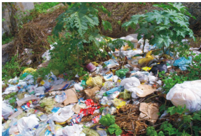
FIGURA 2 – Um cenário comum: “berçários” de mosquitos.

15) Entregue seus pneus velhos ao serviço de limpeza urbana ou guarde em local coberto.