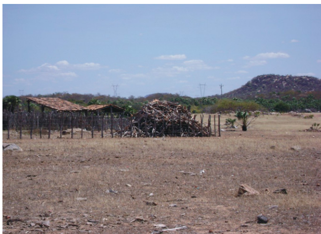
Figura 4 – O provável futuro deserto de IRAUÇUBA (distante 150 quilômetros de Fortaleza).

Matéria veiculada no jornal O Povo (16 de junho 2007) lembra que além de Irauçuba, na Região Norte do Estado, Canindé e distritos em seu entorno entram no mapa dos territórios em estágio avançado de desertificação. Segundo estimativa do Painel Intergovernamental de Mudanças Climáticas da Organização das Nações Unidas (ONU), em torno de 16% da área brasileira correm risco de virar desertos ou semidesertos em 60 anos. Trinta e dois milhões de pessoas (cerca de 18% da população do País) podem ficar sem a terra como meio de sustento. É conveniente lembrar que a desertificação é definida como sendo a degradação da terra nas regiões áridas, semiáridas e subúmidas secas, resultante de vários fatores, entre eles as variações climáticas e as atividades humanas. Segundo dados das Nações Unidas, o processo de desertificação vem colocando fora de produção aproximadamente 60.000 km de terras