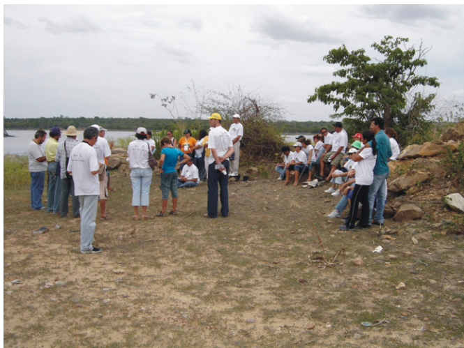
FIGURA 7 – O uso de roupas e a diminuição do nível de exposição à radiação solar são duas opções mais eficientes do que a utilização dos filtros solares.