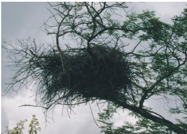
FIGURA 1 – Lixo natural.

sua também adorada filha, provavelmente serão jogados fora, ou seja, no lixo, após o término das festividades. Não esquecendo, é claro, o próprio presente, um lixo em potencial.