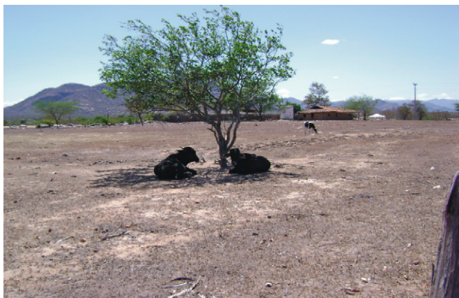
FIGURA 3 – Os animais ditos “irracionais”(?) “sabem” o valor das plantas.

região Norte do país, enquanto a maioria negra ocupa a Sul. Sendo que as duas regiões estão travando uma violenta guerra civil por motivos étnicos que já matou em torno de 70 000 mil sudaneses e deixou, dentre outras consequências, um “exército” de cerca de 1,5 milhão de refugiados. O que seria daquelas pessoas que escaparam da morte, foram expulsas de suas terras por milícias árabes e não tem para onde ir sem a presença pontual daquelas árvores?