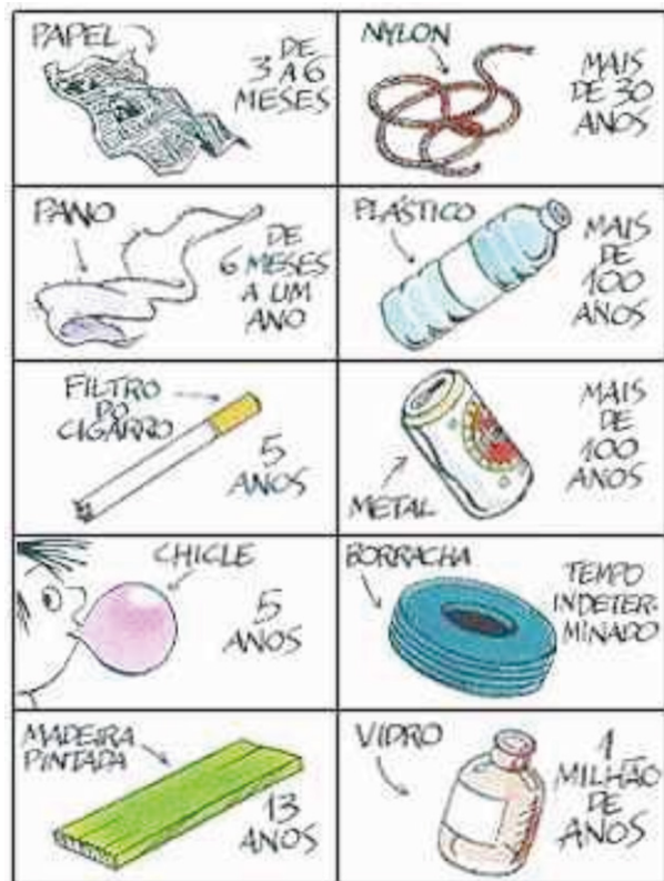
Tabela 2 – Tempo de decomposição de alguns materiais.

degradados em seus compostos mais simples, podendo, então, reentrar nos ciclos biogeoquímicos (Tabela 2).