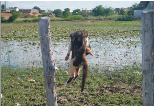
FIGURA 6 – Este é o destino de muitos animais domésticos.

Encerro esse capítulo com uma frase de Carson (1962), que classifiquei como interrogativa-reflexiva: “aquiscendo em praticar um ato que ocasiona tamanho sofrimento a uma criatura vivente, quem, dentre nós, não fica diminuído como ser humano?”