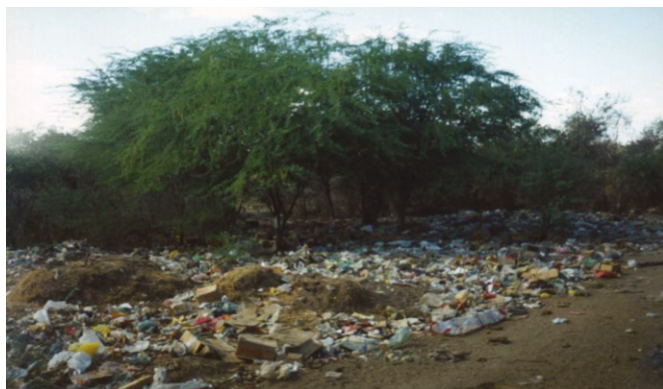
FIGURA 5 – Uma paisagem cada vez mais comum sem a reciclagem

Com base na definição de ecossistema dada pelos autores percebemos que o uso intensivo de sacolas plásticas interfere diretamente no primeiro princípio básico na manutenção dos ecossistemas: a ciclagem dos elementos químicos. Conforme já discutido no capítulo dois, os plásticos não estão acessíveis aos seres decompositores, acumulando-se no ambiente. Embora estejamos caminhando para uma possível melhora nesse quadro, pois segundo reportagem da revista Veja (20 de dezembro de 2006) o Brasil é o país que mais recicla alumínio no mundo. Também avança muito no reaproveitamento de plástico. Sendo recicladas 460.000 toneladas desse material em 2005. O mercado de plástico cresceu 32% nos últimos três anos.