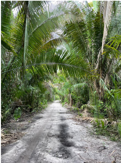
Foto 22: Palmeiral Vila Esperança, Esperantina - PI. (Fevereiro, 2023).