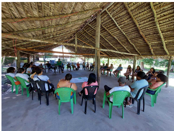
Foto 25: Reunião MIQCB-PI e Secretaria do Meio Ambiente de Esperantina, Olho D'Água dos Negros, Esperantina - PI (Fevereiro, 2023).