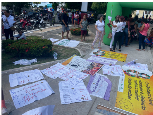
Foto 19: Cartazes do ato em Codó no Dia Internacional das Lutas das Mulheres, dia 8 de Março. Se lê nos cartazes: Menos feminicídio, Menos Racismo, + Amor. Floresta de Babaçu em Pé!. DAP/CAF para as Mulheres. Sem Feminismo não há Agroecologia. Quebradeiras de coco - As Guardiãs da Floresta. Lugar de Mulher é Onde ela quiser. Codó - MA (Março, 2023).