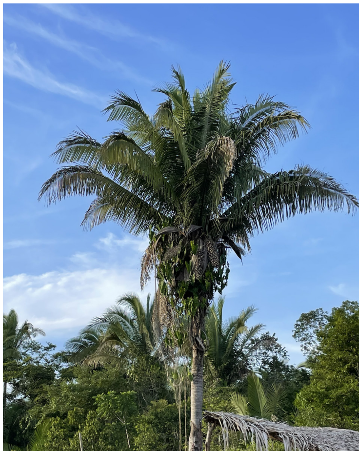
Foto 10: Palmeira do Babaçu, Vila Esperança, Esperantina - PI (Fevereiro 2023).