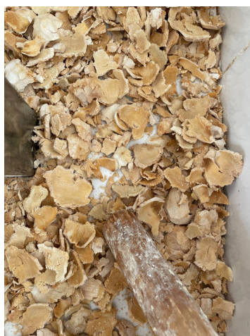
Foto 21: Mesocarpo do babaçu durante a produção da farinha de mesocarpo. Centro de Produção de Mesocarpo, Chapada da Sindá, São João do Arraial - PI (Janeiro, 2023).